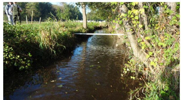
Le même après traitement