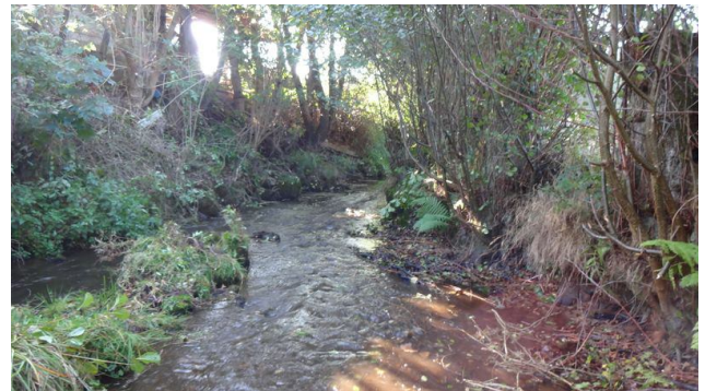
Le même après